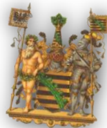
Preussische Provinz Sachsen