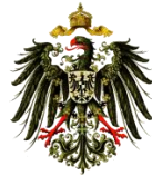
Preussische Provinz Sachsen