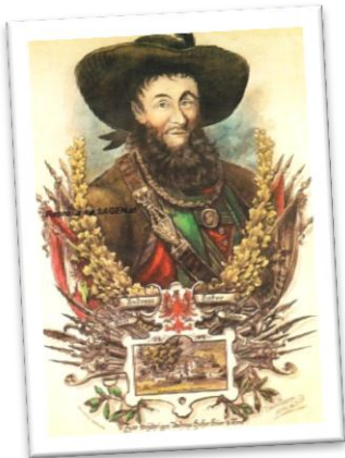
Unbekannt, 20. Jh.