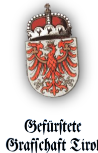
Gefürstete Grafschaft Tirol