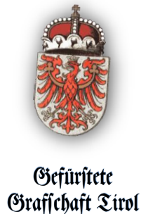
Gefürstete Grafschaft Tirol