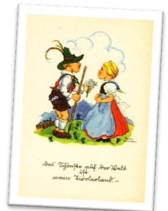
Unbekannt, 20. Jh.