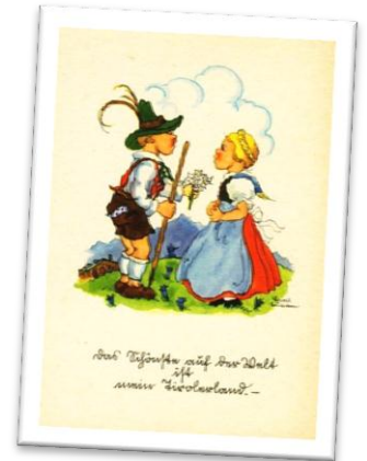
Unbekannt, 20. Jh.