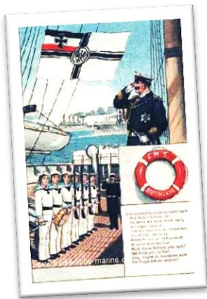
Matrosen, 20. Jh