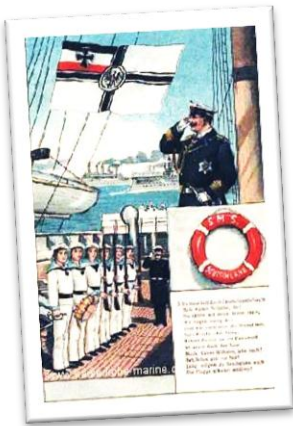
Matrosen, 20. Jh.