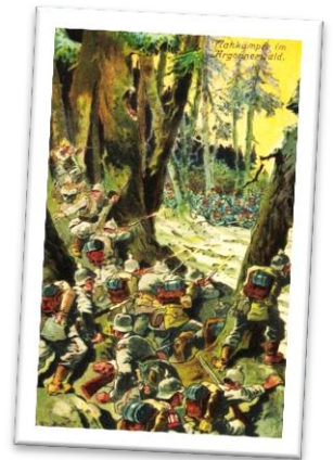
Schott, 20. Jh.